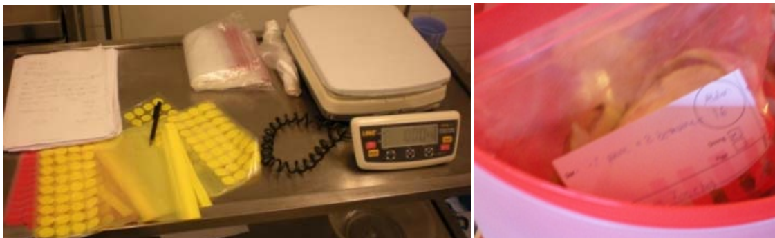
Figur 1. Vægt, labels, poser og spand til registrering af indtag af frugt og grønt.

For hver klasse blev frugt- og grøntindtaget ved frugtordningen registreret og vejlet for hver af de deltagende elever over to dage. Først blev tre stykker af hver slags frugt og grønt vejlet for at bestemme den gennemsnitlige vægt af hver frugt.