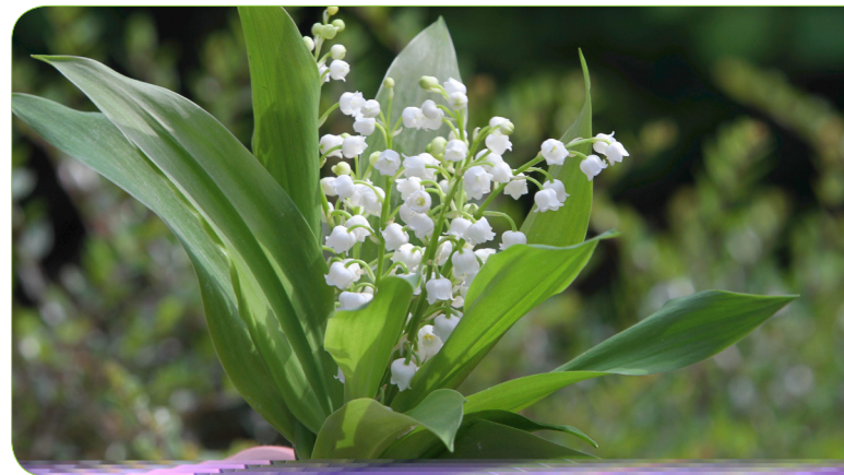
Figur 3. Blomstrende liljekonval

Forekomst af den type stoffer er også kendt fra andre løgarter som for eksempel hvidløg. Forgiftninger hos mennesker som følge af indtagelse af blade fra korrekt identificerede ramsløg er ikke beskrevet.