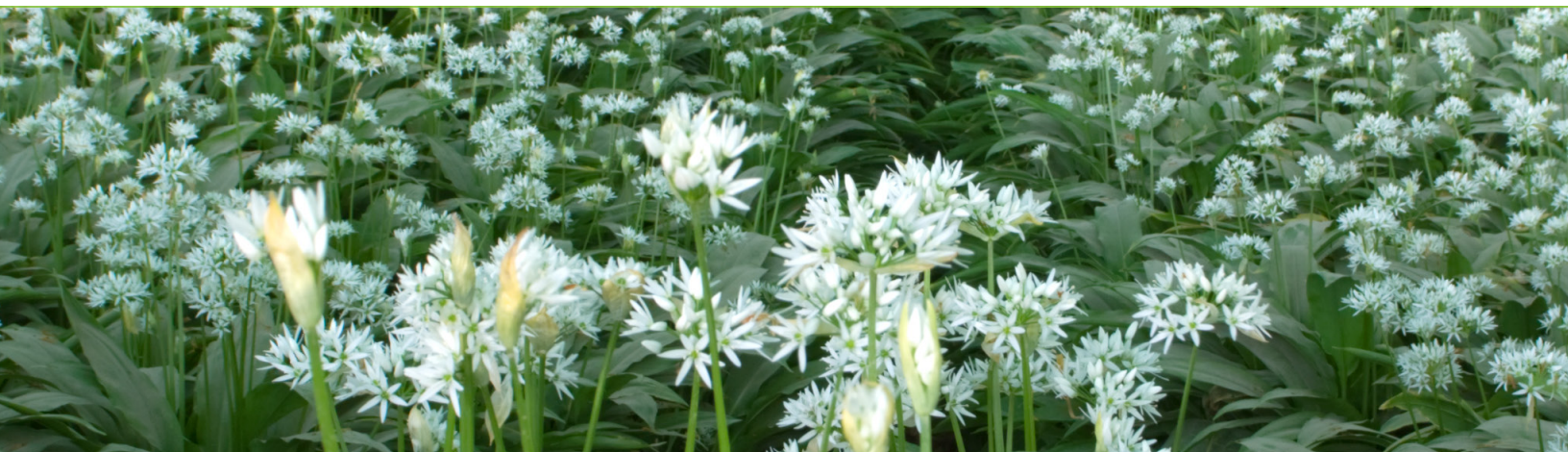
Figur 2. Blomstrende ramsløg

Fra Kroatien, Slovenien og Østrig, Schweiz og Italien er forgiftningstilfælde med høsttidløs også rapporteret. Her forvekslede de forgiftede også høsttidløs med ramsløg (Brvar et al. 2004, Garbrscek et al. 2004, Sundov 2005, Klintschar M 1999, Hostettmann 2009, Colombo et al. 2009, Weidmann 2006). I Italien var 2 ud af 11 af forgiftningstilfælde med høsttidløs med dødelig udgang.