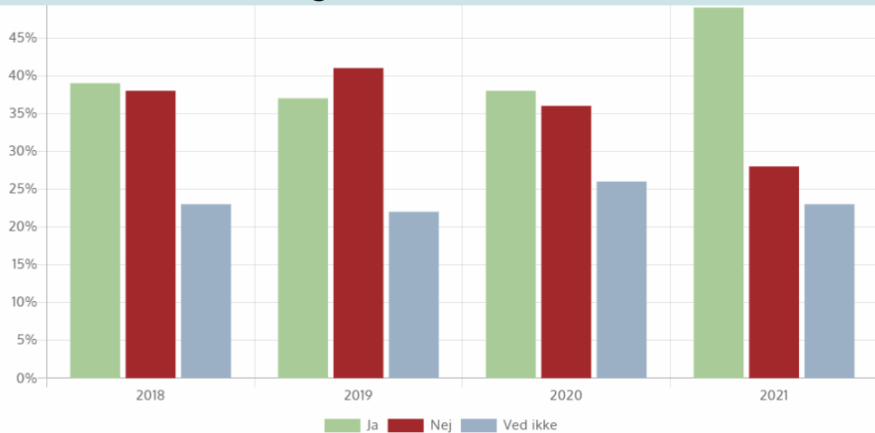
Mener du at kødforbruget i Danmark bør reduceres?