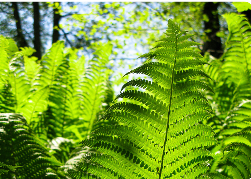
Almindelig strudsvinge ( Matteuccia struthiopteris (L.) Tod.)

I nye kogebøger anbefaler forfatterne, at man spiser mange utraditionelle planter som gærdevikke ( Vicia sepium L.) og skud fra almindelig røn ( Sorbus aucuparia L.), hvor de svagt udfoldede skud skulle have en fin smag i retning af bittermandler og være en delikatesse i salatskålen. DTU Fødevareinstituttet har foretaget en litteratursøgning i den videnskabelige litteratur og finder ingen beskrivelser af, at mennesker har spist hverken gærdevikke eller rønnebærblade.