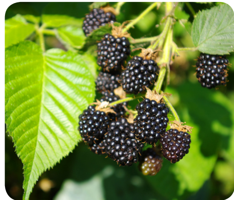
Frugter fra almindelig brombær ( Rubus fruticosus L. s.l.)