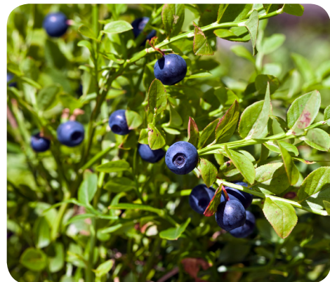
Frugter fra almindelig blåbær ( Vaccinium myrtillus L.)