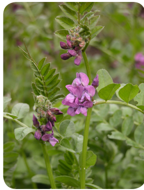
Gærdevikke ( Vicia sepium L.)