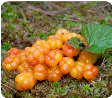
Frugter fra muldebær ( Rubus chamaemorus L.)