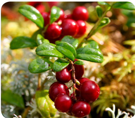
Frugter fra tyttebær ( Vaccinium vitis-idaea L.)

En del af de nævnte planter findes både som vilde planter og som dyrkede.