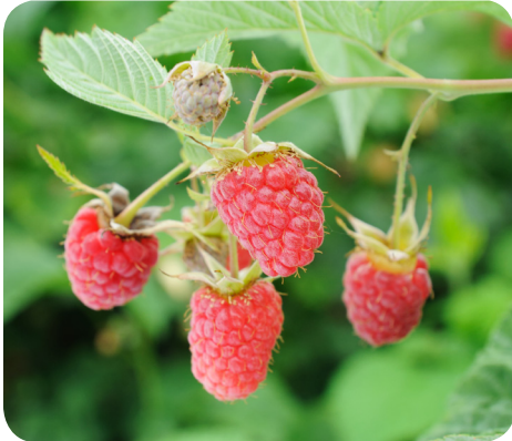
Frugter fra almindelig hindbær ( Rubus idaeus L.)