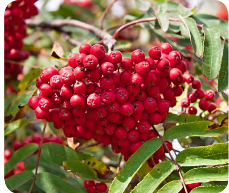
Frugter fra almindelig røn ( Sorbus aucuparia L.)