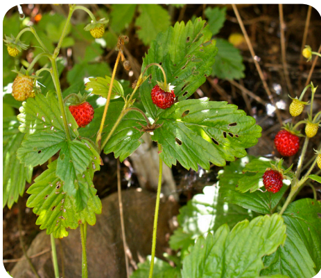
Frugter fra skovjordsbær ( Fragaria vesca L.)