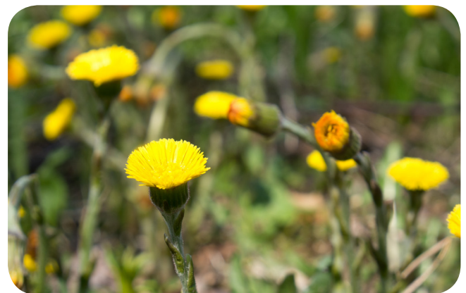
Almindelig følfod ( Tussilago farfara L.)

I nogle kogebøger og på websites skriver forfattere, at kronblade og forskellige andre plantedele fra den vilde plante almindelig følfod ( Tussilago farfara L.) er spiselige. DTU Fødevareinstituttet fraråder kraftigt at