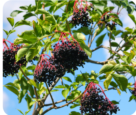
Frugter fra almindelig hyld ( Sambucus nigra L.)