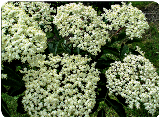
Almindelig hyl (Sambucus nigra L.)

Traditionelt har hyldebær været indtaget efter varmebehandling i for eksempel saft eller suppe (Boyhus & Carlsen 2000). I de senere år, hvor smoothies er blevet populære, har der været flere tilfælde af akut sygdom med kvalme, opkastning og diarré hos restaurationsgæster, der fik serveret smoothies fremstillet af rå, modne hyldebær.