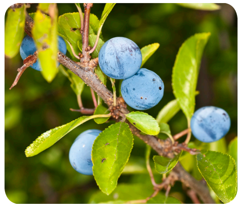
Frugter fra slåen ( Prunus spinosa L.)