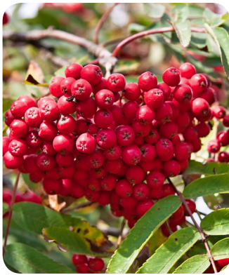
Almindelig røn ( Sorbus aucuparia L.)