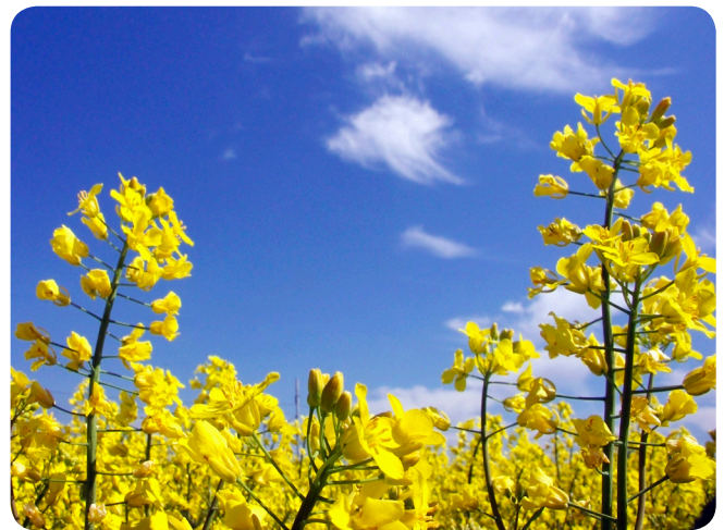
Raps ( Brassica napus L.)

Rapsolie er blevet vældig populær i det danske køkken, men det er forholdsvis nyt. En bog om nytteplanter fra 1937 (Gram et al. 1937) omtaler rapsolie for dens gode egenskab som smøreolie og nævner, at hjemmeproduceret rapsolie i første halvdel af 1800-tallet blev brugt som belysningsolie i olielamper. Rapsfrø blev ikke brugt til fremstilling af spiseolie, fordi de indeholdt et højt indhold af den monoumættede fedtsyre erucasyre (cis 13-docosensyre) og glukosinolater (Abbadi & Leckband 2011).