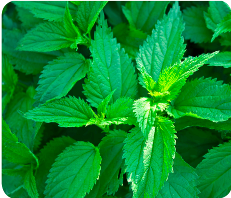
Blade fra stor nælde ( Urtica dioica L.)